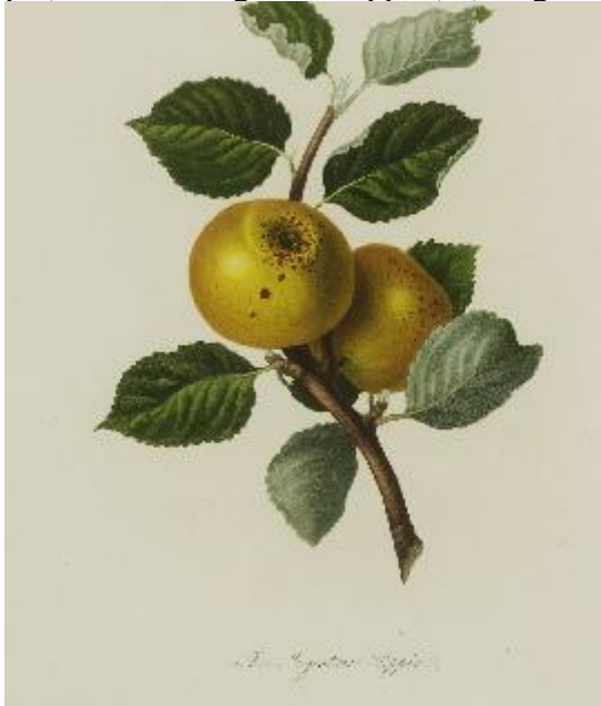
Pomona Londinensis 1818,V1,William HOOKER.

SYNONYMES : Yellow Ingestrie(T.A.Knight « Transactions of the hort. Society de London », 1811, t.1, pp.226/28).- Gelber Pepping von Ingestrie (Diel « Kernobstsorten », 1825, t.3, p.4).- Yellow Ingestrie Pippin(d°), Ingestrie pippin.